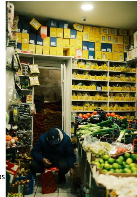
Stockage en boutique, Paris