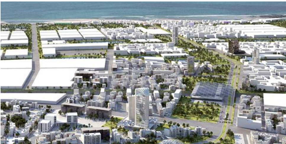
Nouveau pôle urbain de Zenata, en banlieue de Casablanca.