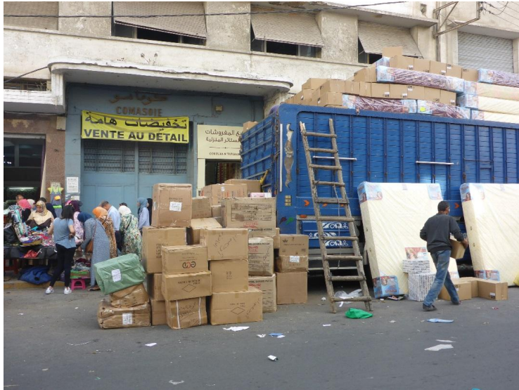
Maroc, Casablanca, quartier Derb Omar

Transfert du marché de Derb Omar à Casablanca: ce qu'il en est actuellement (et réellement) – le 360 , 02/02/2025